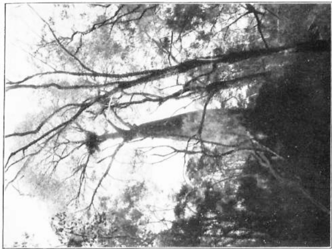
Auf einem hohen Nadelbaum war das Nest ... (C. 191.)