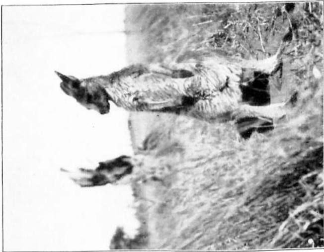
Sie lassen aufrecht am Wege, machen Rucksäcke wie Hufen. (Z. 193.)