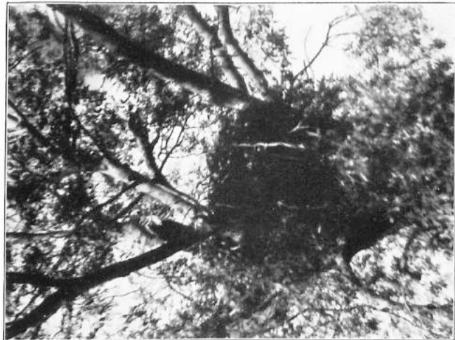
... in ihm saß ein junges, aber schon ziemlich ausgewachsenes Adler. (C. 192.)

Es wäre eine Kleinigkeit gewesen, ihn zu fischen.