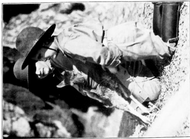
Kenate nahen es auf den Echhof. (Z. 193.)

Am Land der lebenden Fossilien gibt es noch Beuteltiere, die auf der übrigen Erde längst ausgestorben sind.