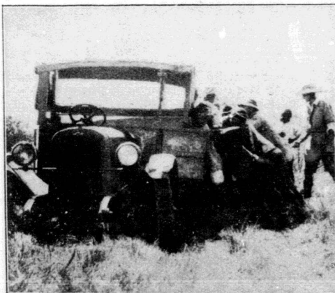
Unser Auto blieb in der Somoban im Sumpf stecken. Wir mußten es einfach stehen lassen.