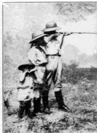
Ein Paradies für unsere Kinder: Ein Jahr lang keine Schule — dafür Schießunterricht.