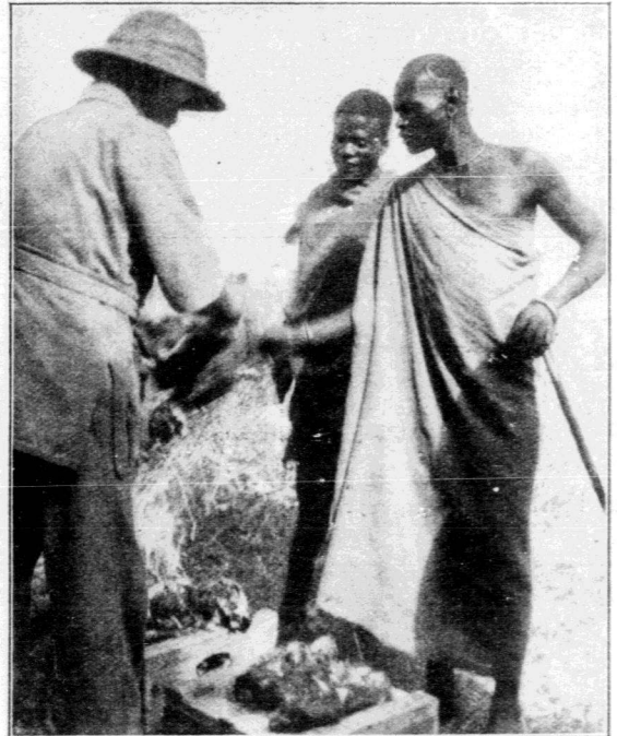
Die Träger zahlten wir mit Fleisch von unserer Jagdbeute — für Geld wäre keiner gekommen!