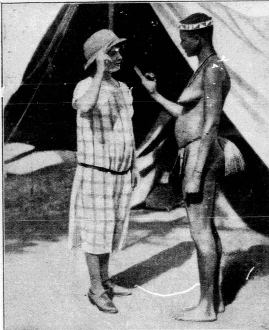
Internationale Verständigung! Was würde man tun, wenn man keine Finger zum Zählen hätte!