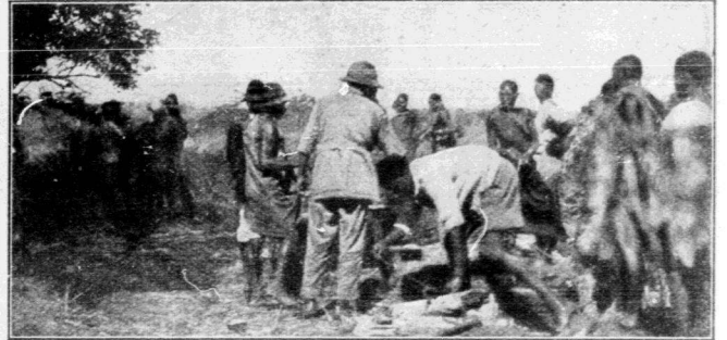
Verteilen Sie mal Ihren Hausstand in Lasten zu 25 Kilo an die Träger!