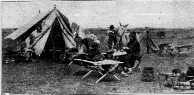
So errichteten wir unsern Hausstand in der afrikanischen Steppe.