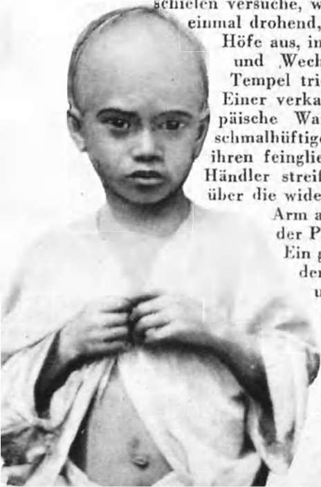
Ein indischer Lausbub

Ein großer, schwerer Mann hockt neben dem Mädchen und schaut besitzend und genießerisch zu, wie dem Mädchen — nein, seiner jungen, knabenhaften Frau — der qualvolle Schmuck angelegt wird wie eine Fessel. Vom Eingang tönt