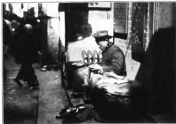
Schuhmacher in Hongkong