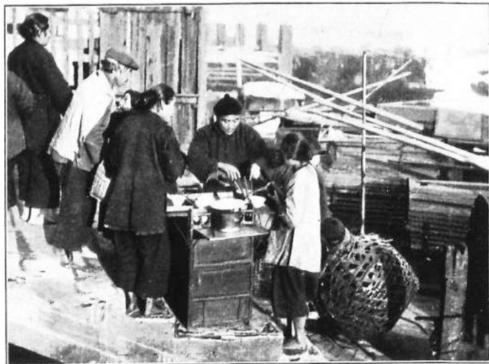
Gaststätte vor dem großen Hotel in Kanton