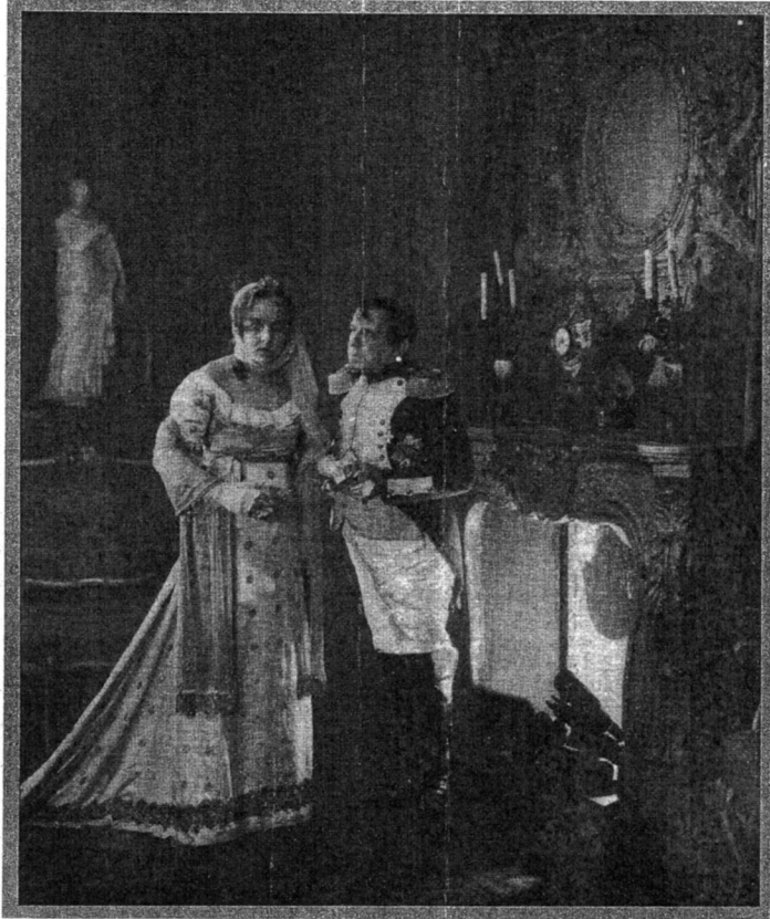
Aus dem Bruckmann-Film „Wenn Steine reden“

Im Laufe der Zeit erwies es sich als zweckmäßig, Reisefilme nicht lediglich als Beifilme von 100, 200 oder 300 Meter Länge neben Spielfilmen vorzuführen. Es wurden